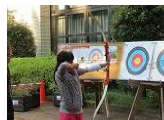
アーチェリー体験