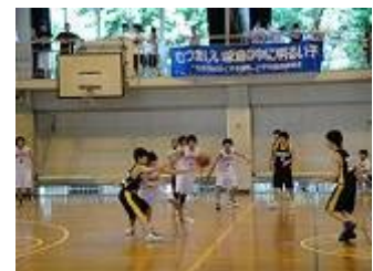
バスケットボール大会