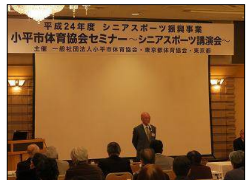
小川会長あいさつ