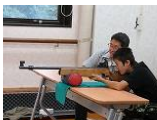
ビームライフル体験