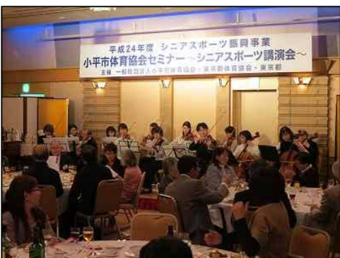
アンサンブル・ルナーレ演奏